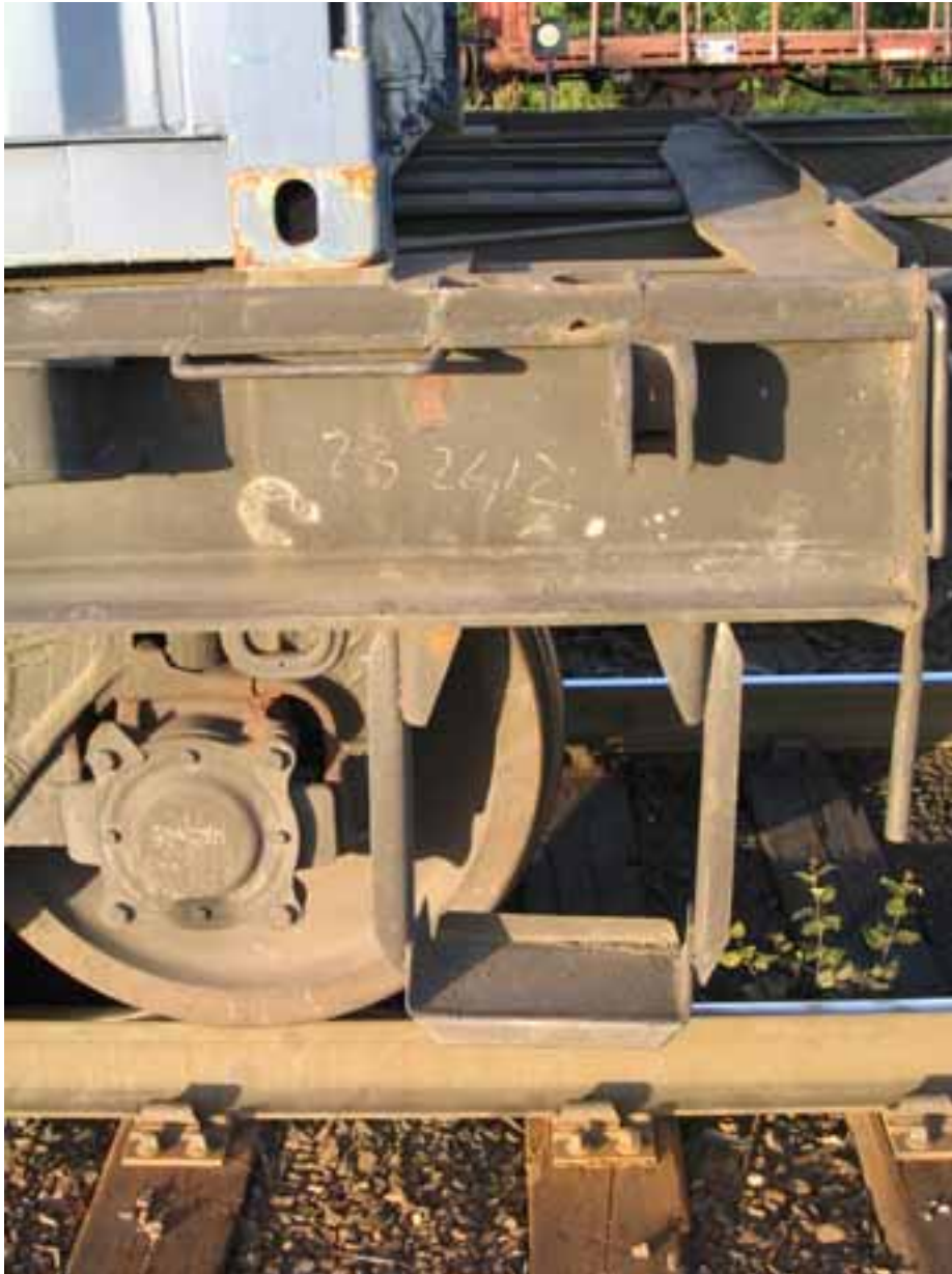
Kuva 3. Astin, jolla junamies seisoi ennen onnettomuutta, sekä käsirivat.

Bild 3. Fotsteget som tågkarlen stod på före olyckan, samt ledstängerna.