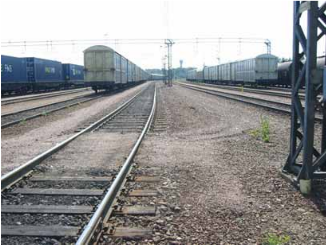
Kuva 5. Näkymä vasten vaihtotyöyksikön kulkusuuntaa. Junamies jäi makaamaan kiskon viereen kuvassa näkyvän hiekkatasokäytävän jälkeen. Kuvassa raiteen vasemmalla (vaihtotyöyksikön kulkusuunnassa oikealla) puolella on kävelykulkutie, mutta oikealla puolella on tavallista raidesepeliä.