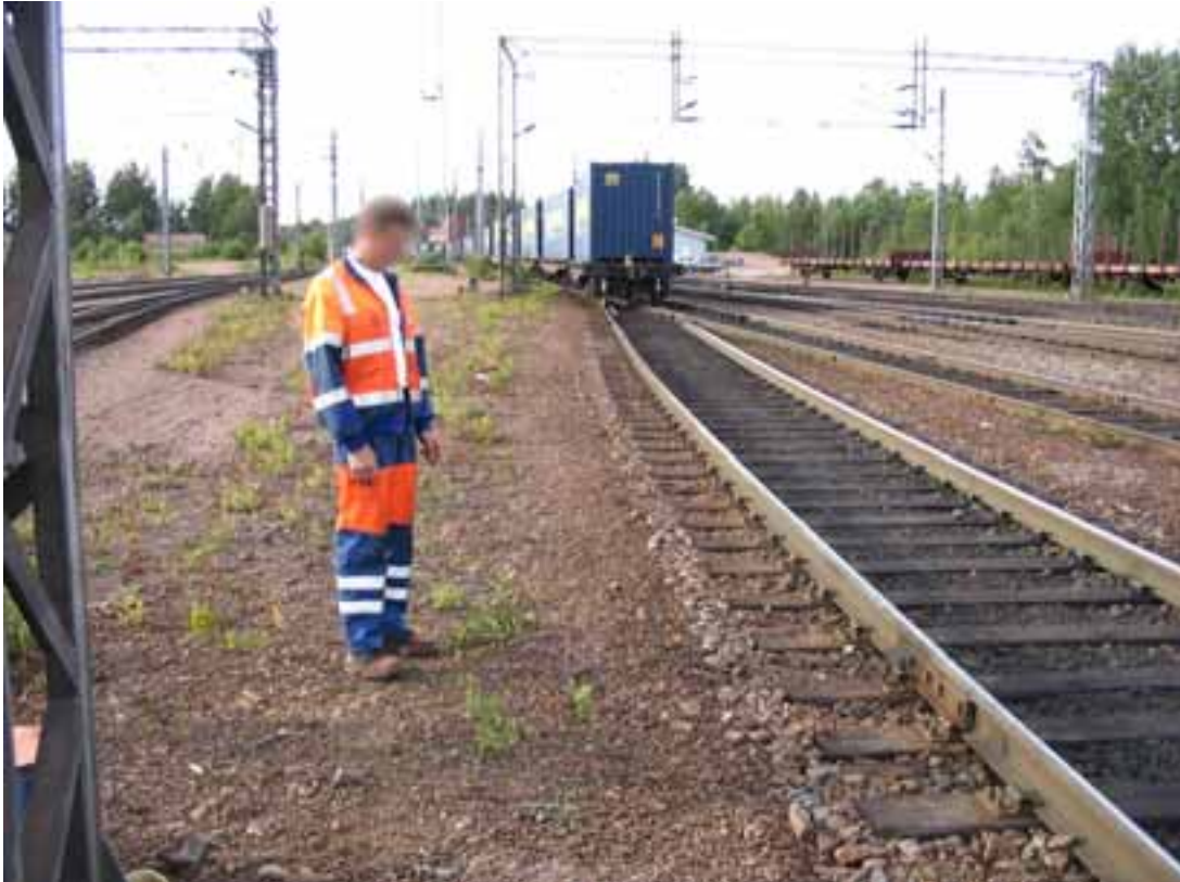
Kuva 2. Kuva onnettomuuspaikasta. Vaihtotyöyksikkö liikkui onnettomuuden jälkeen noin 60 metriä ennen pysähdystä.

Haminan yksityisen sairaankuljetuksen ambulanssi H390 ajoi harhaan ja oli paikalla pari minuuttia pelastusyksikön jälkeen. Onnettomuuteen hälytettiin myös lääkärihelikopteri MediHeli. Sairaankuljetusyksiköiden ja pelastusyksikön henkilöstö antoi potilaalle ensihoidon ja laittoi hänet kuljetuskuntoon. Potilas kuljetettiin sairausautolla suoraan Helsinkiin. Matkan aikana lääkärihelikopteri laskeutui Pyhtäälle valtatie 7:n levähdyspaikalle ja siellä MediHelin lääkäri siirtyi sairausautoon.