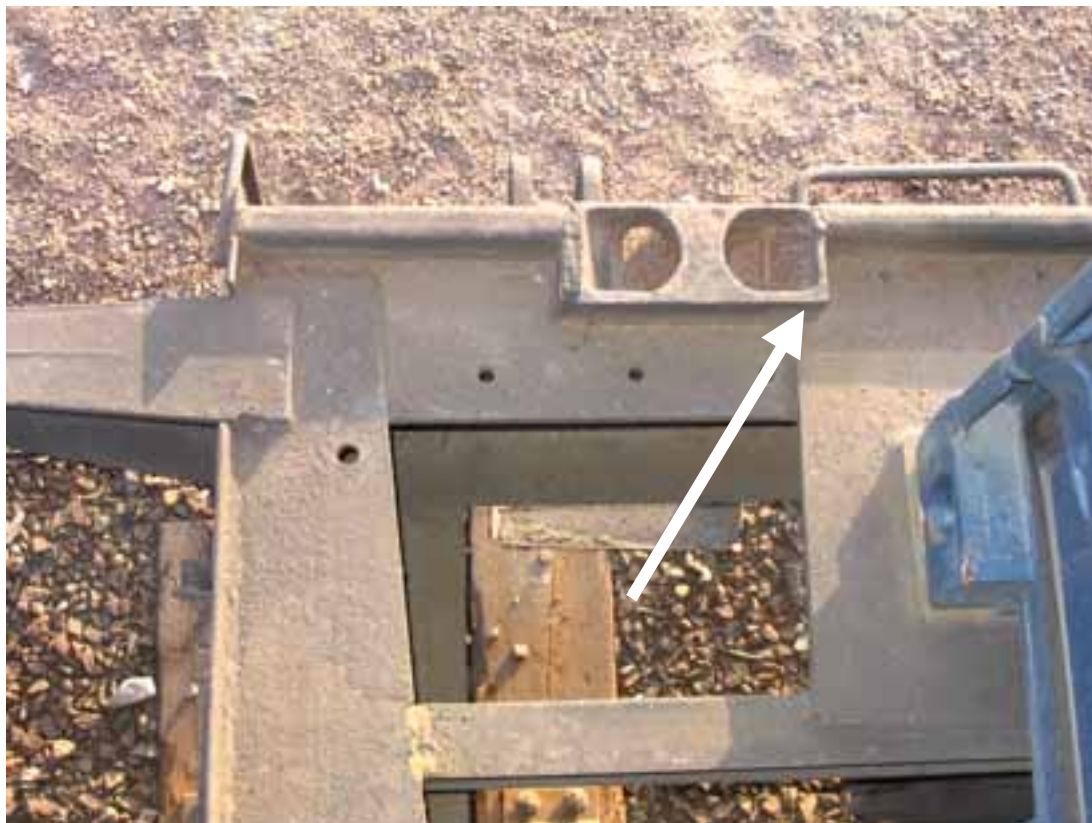
Kuva 4. Vaunun astimen käsirivat ylhäältä päin katsottuna. Vaakasuorassa olevan käsirivan vieressä näkyy nuolella merkitty teräväsärmäinen uloke.